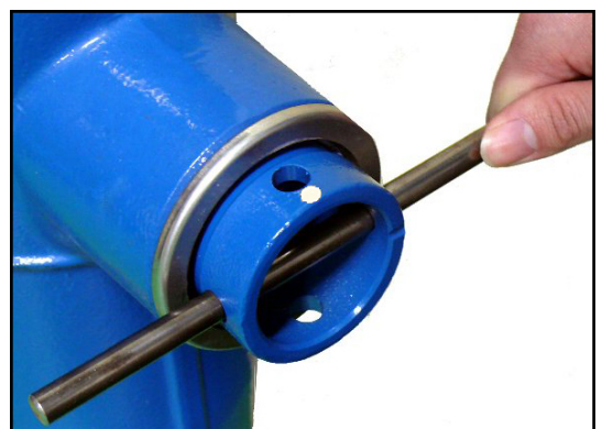
固定時（ロック） 白色ペイントが上