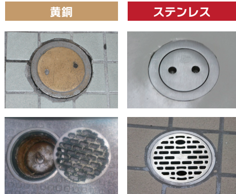
ステンレス鋳鋼製は丈夫で長持ちですからメンテナンスの軽減にもつながります

ステンレスは素材そのものに耐食性があるため、めっき加工する必要がありません。ですから黄銅製のようにめっきが剥がれ落ちることなく、素材の良さが持続します。